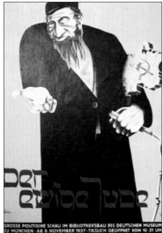
Propaganda-Plakat 1937

Bis 1933 war das europäische Judentum immer wieder der antisemitischen Propaganda und den gewalttätigen Aktionen extrem nationalistischer Gruppen ausgesetzt, aber dadurch konnten ihre Grundrechte und gesellschaftlichen Entfaltungsmöglichkeiten nicht entscheidend eingeschränkt werden. Angesichts der „modernen Zeiten“ sah man sich sogar eher verstärkt auf dem Wege der Gleichberechtigung. Nun aber wurde der Antisemitismus, bislang in Westeuropa meist nur Propaganda, in Deutschland zur staatlichen Politik erhoben. Dies markiert den grundlegenden Einschnitt. Es folgte eine zunehmende gesellschaftliche Ausgrenzung der knapp 500000 deutschen Bürgerinnen und Bürger jüdischen Glaubens, die weniger als ein Prozent der Gesamtbevölkerung ausmachten: