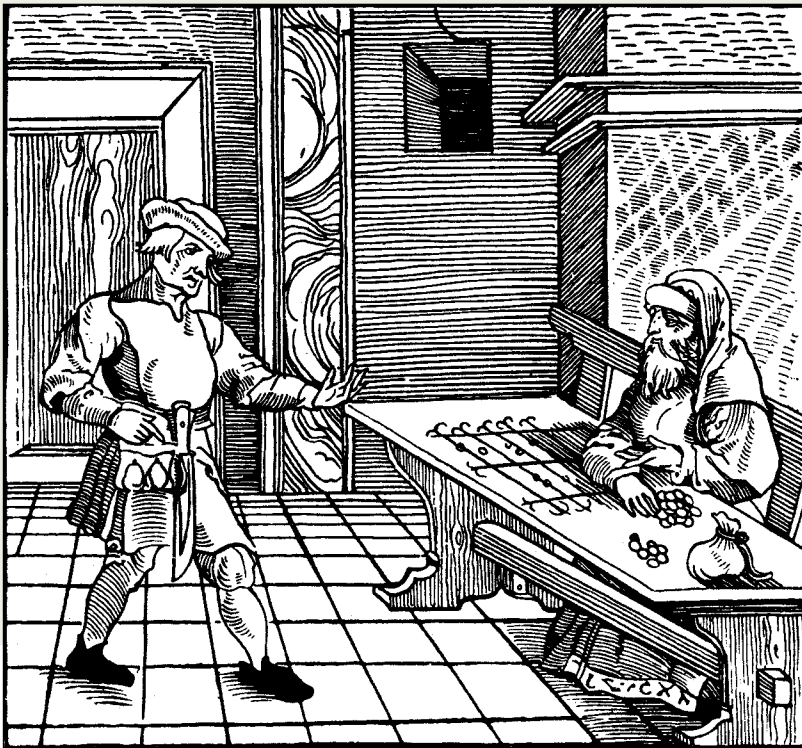
Jüdischer Geldverleiher, Holzschnitt 1531

zusammen mit den bekannten religiös-wirtschaftlichen Vorurteilen (der Jude als arbeitsscheuer Wucherer, der das kanonische Zinsverbot für Christen zu seinen Gunsten ausnutzte) der Gesellschaft immer wieder dazu dienten, den Sündenbockmechanismus in Gang zu setzen und die jüdische Minderheit für alle erdenklichen Probleme verantwortlich zu machen. Dabei muss diese Form der Ausgrenzung von der ‚normalen‘ Abgrenzung im Alltagsleben, die von den religiösen Instanzen beider Gruppen zur Wahrung der sozialen und religiösen Identität gefordert und praktiziert wurde, abgehoben werden. Selbst das später so einschränkende Leben im Ghetto wurde zunächst nicht als die entscheidende Benachteiligung gesehen, war es doch für den mittelalterlichen Menschen an der Tagesordnung, dass z. B. bestimmte Berufsgruppen in eigenen Vierteln zusammen wohnten und eine eigene Kleiderordnung besaßen. Zudem erlaubte das Zusammenleben in abgeschlossenen Stadtvierteln den jüdischen Gemeinden, je nach Region und Wohlwollen des Herrschers bzw. Magistrats, eine partiell wirkungsvolle Selbstverwaltung, was in Zeiten ständischer Herrschaftsstrukturen und angesichts des