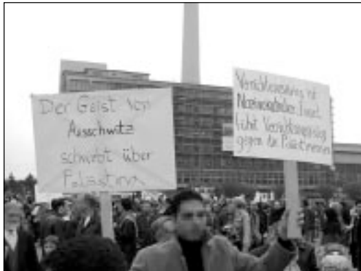
1. April 2002, Berlin-Alexanderplatz

In dieser Hinsicht kann auch von einem „versteckten“ Antisemitismus gesprochen werden, der sich in folgenden Variationen widerspiegelt: