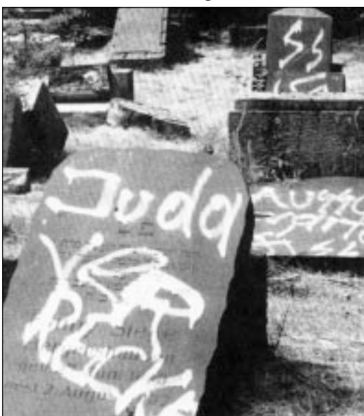
Friedhof in Babenhausen-Sickenhofen bei Darmstadt (1990)